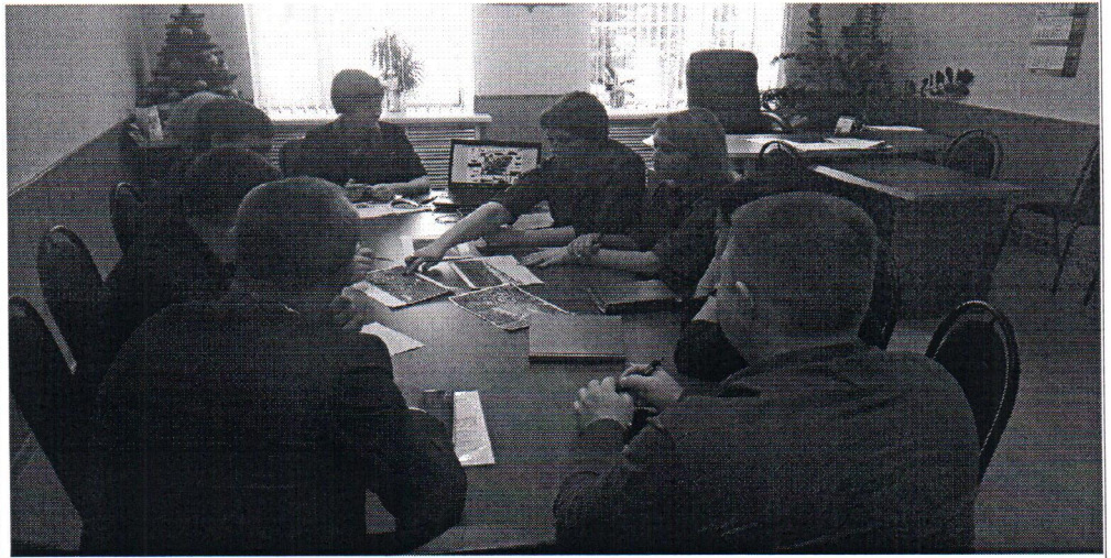
Фото общественных обсуждений

Официальный сайт администрации городского округа Перевозский во вкладке Всероссийский конкурс лучших проектов создания комфортной городской среды в категории «малые города» до 10 тыс.чел.