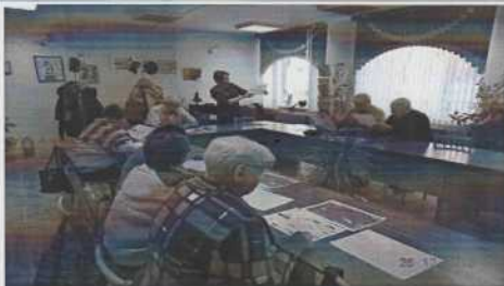
Фото общественных обсуждений

Официальный сайт администрации городского округа Перевозский во вкладке Всероссийский конкурс лучших проектов создания комфортной городской среды в категории «малые города» до 10 тыс.чел.