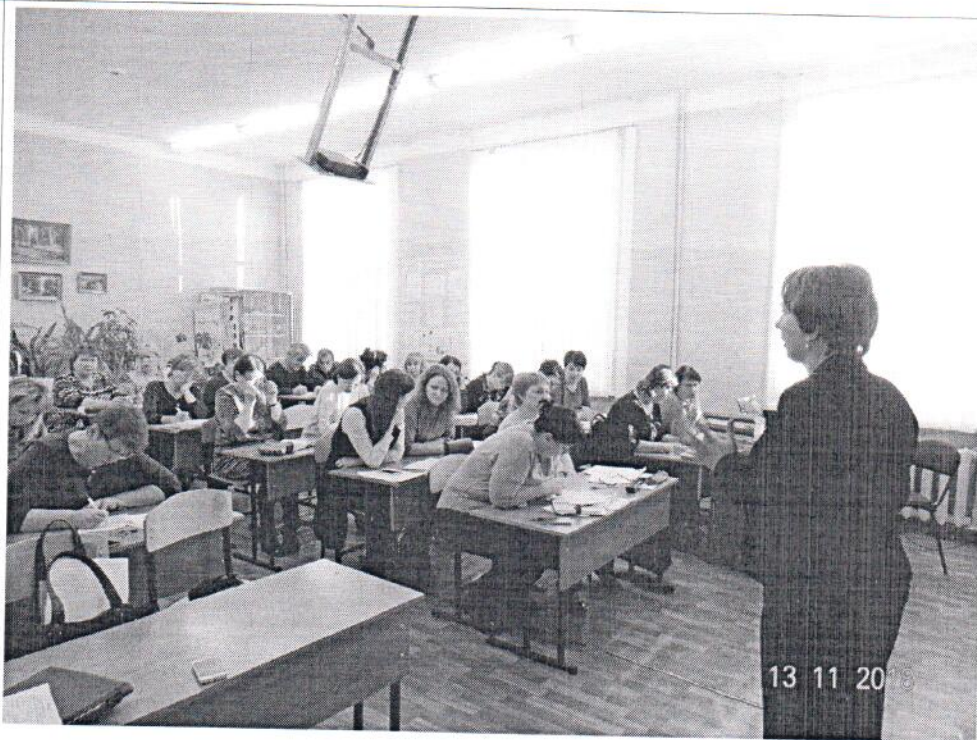
Фото общественных обсуждений