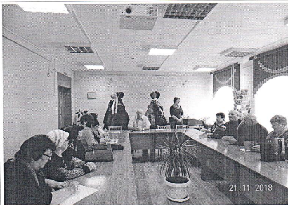
Фото общественных обсуждений